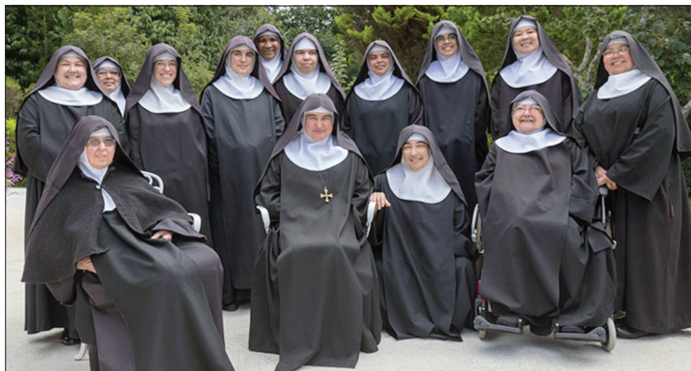
Monastère de São João, Brésil

religieuses, de langues et de cultures différentes. C'est là que nous avons constaté le sens des observances et des règles de la vie commune dans un milieu monastique. Toutes ces connaissances et ces expériences acquises au cours de ces deux mois, un par an, nous ont donné une nouvelle ferveur, spirituelle et personnelle à vivre et à partager avec notre communauté. Nous avons partagé ce que nous avons appris et reçu dans le cadre de la formation continue pour les moniales, avec les jeunes en formation et les oblats séculiers. Nous avons mis en pratique nos nouvelles connaissances dans les domaines de la catéchèse, de l'accompagnement spirituel et de l'accueil de nos hôtes ou de ceux qui nous demandent des conseils.